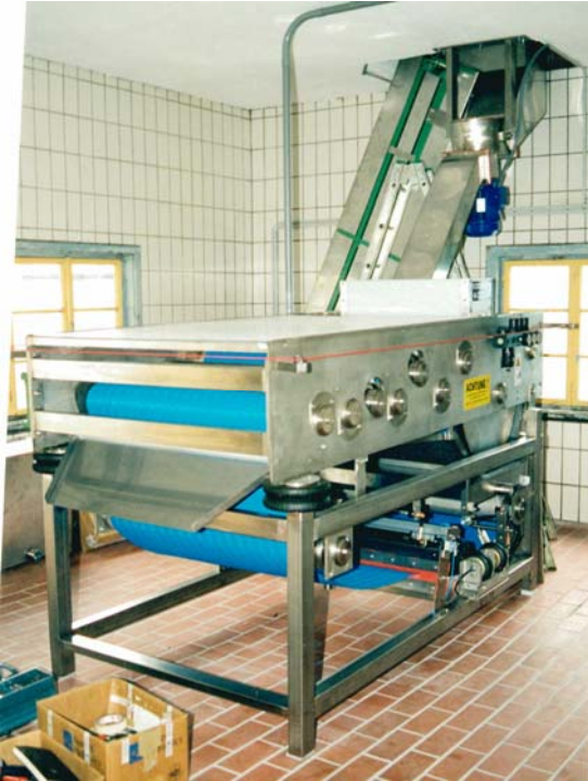
EB1004 mit Schrägelevator

Hohe Ausbeute bei geringem Trubanteil im Saft