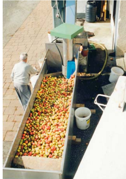
Aufschüttwanne Für Elevator