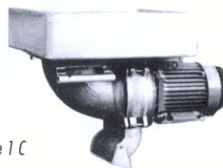
Obstmühle 1 C